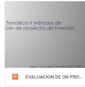
EVALUACION DE UN PRO...